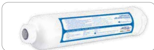
CARTUCCE CARBONE IN-LINE CA 10 MICRON serie IN-LINE CARBON IN-LINE CA 10 MICRON series IN-LINE