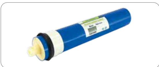
CARTUCCE A MEMBRANE PER OSMOSI serie OSMOSI MEMBRANE CARTRIDGES FOR OSMOSIS series OSMOSI